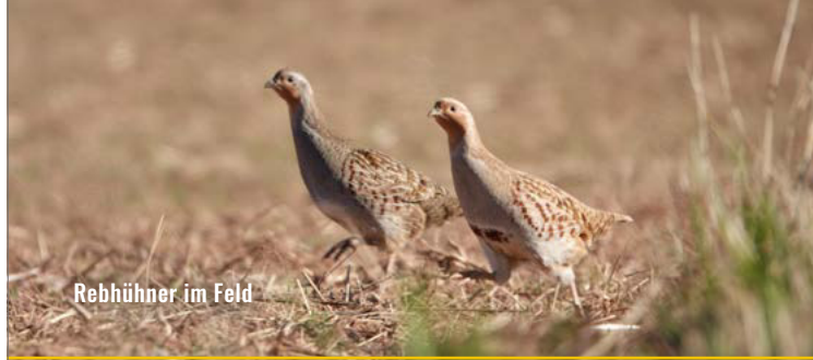
Rebhühner im Feld