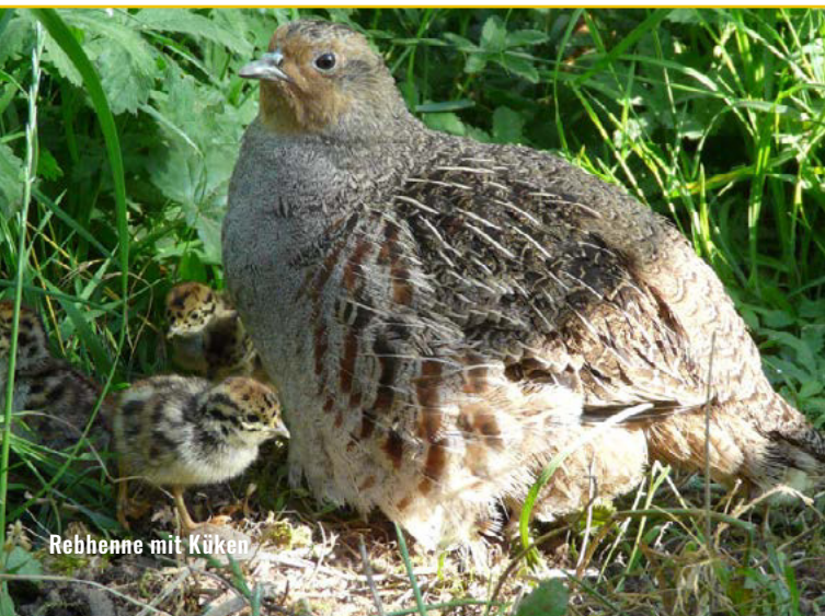
Rebhenne mit Küken

Nach dem Ende der Eiablage (meist Juni), beginnt die Henne mit der Brut (Brutzeit Ø 24–25 Tage). Die Küken schlüpfen meist alle an einem Tag im Juli. In den ersten Lebenstagen ernähren sich die Jungen hauptsächlich von Insekten (z. B. Ameisennestern). Spätestens ab Mitte August sind die Jungen dann selbstständig. Im September / Oktober mausern die Jungen und sind ab November kaum von den Elterntieren zu unterscheiden. Die Nahrung erwachsener Rebhühner besteht hauptsächlich aus Samen und Pflanzenteilen.