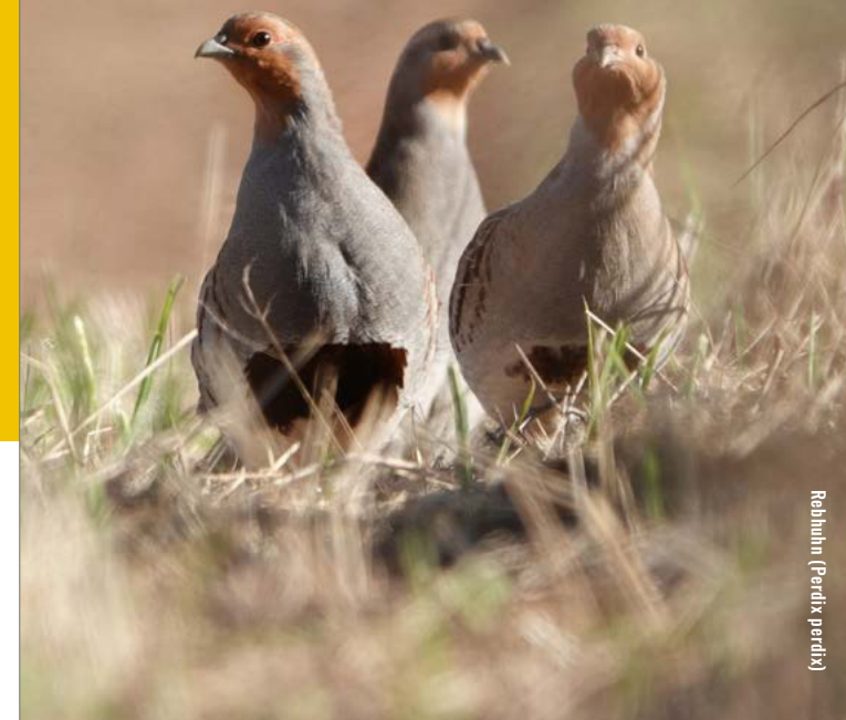
Rebhuhn (Perdix perdix)