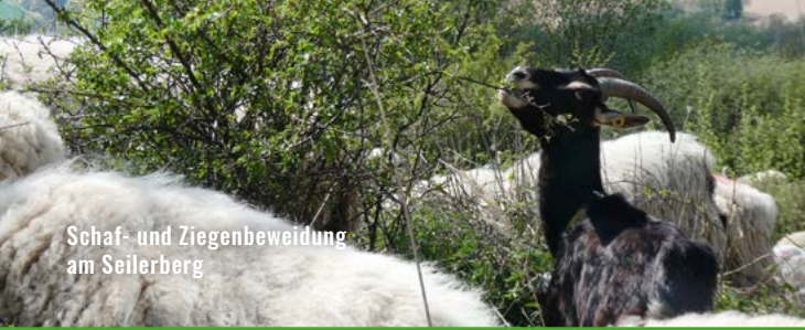
Schaf- und Ziegenbeweidung am Seilerberg