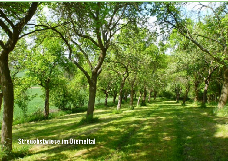
Streuobstwiese im Diemeltal